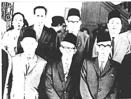
Tun Dr. Ismail (barisan hadapan, dua dari kanan) bersama Tun Abdul Razak (kanan sekali) dan menteri-menteri kabinet yang lain.

Memandangkan Tun Dr. Ismail pernah meletakkan jawatan sebagai menteri maka kembalinya beliau ke dalam pimpinan negara mungkin menimbulkan spekulasi. Namun begitu Tun Dr. Ismail menyatakan pendiriannya bahawa beliau kembali melibatkan diri dalam politik atas dasar membantu Tun Abdul Razak mengembalikan semula kekuatan negara. Bagi beliau sebagai anggota parti maka setiap anggotanya bertanggungjawab terhadap parti. Beliau mengatakan kembalinya beliau ke dalam kabinet adalah atas permintaan Tun Abdul Razak. Berhubung dengan perkara ini Tun Dr. Ismail menyatakan: