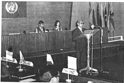
Yang Amat Berhormat Perdana Menteri dan Menteri Hal Ehwal Dalam Negeri, Tun Dr. Ismail bin Dato Haji Abdul Rahman kelihatan sedang berucap di persidangan pura-pura Majlis Mesyuarat Bangsa-Bangsa Bersatu yang diadakan oleh murid-murid sekolah menengah di Dewan Tunku Abdul Rahman, Kuala Lumpur. Persidangan pura-pura ini dianjurkan sempena ulangtahun ke-25 Pertubuhan Bangsa-Bangsa Bersatu.

Tun Dr. Ismail juga menegaskan tentang peranan para pelajar dan belia membantu kerajaan untuk mencapai objektif kerajaan bagi membina Malaysia yang bersatu di samping mendaulatkan bahasa kebangsaan. Apa yang lebih penting adalah tugas dan peranan para belia serta pelajar membentuk sebuah masyarakat yang adil dan makmur. 18