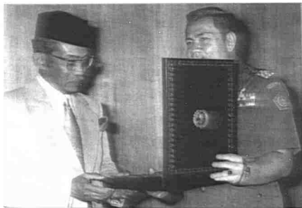
Timbalan Perdana Menteri, Tun Dr. Ismail bin Dato' Abdul Rahman sedang melakukan sambutan rasmi ke Indonesia pada 8.7.1972. Tun Dr. Ismail telah mengantarai Tuan Yong Terutama Menteri Negara Bagi Pertahanan Indonesia, Jenderal M. Panggabean di Wlawa Juna.

Walaupun wujud perbezaan corak kepimpinan antara beliau dengan Tun Abdul Razak tetapi beliau dapat menyesuaikan diri berkhidmat di bawah pimpinan Tun Abdul Razak. Memang diakui bahawa Tun Dr. Ismail mempunyai pendekatan yang tegas. Namun begitu, beliau tetap menjalankan tugas-tugas yang diarahkan oleh Tun Abdul Razak sebagai Perdana Menteri. 29