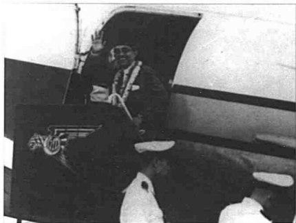
Tun Dr. Ismail bertolak ke Pertubuhan Bangsa-Bangsa Bersatu pada September 1957.

Dengan pemilihan Tun Dr. Ismail sebagai Ketua Perwakilan dan Duta Negara, beliau terpaksa menjalankan dua tugas serentak. Ini menunjukkan keistimewaan yang dimiliki oleh beliau sebagai seorang pemimpin. Sepanjang perkhidmatan beliau sebagai wakil Persekutuan Tanah Melayu, beliau telah cuba mengemukakan idea-idea yang bernas.