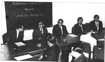
Tun Dr. Ismail sedang berucap dalam mesyuarat dengan pegawai-pegawai Badan Pencegah Rasuah di Kuala Lumpur.

Jika dinilai sikap dan pandangan Tun Dr. Ismail, beliau mempunyai keinginan mewujudkan sebuah kerajaan yang bersih dan jujur. Amalan rasuah dipandang sebagai satu penyakit yang jika dibiarkan merebak akan memusnahkan bangsa. Oleh itu semasa menjadi menteri beliau tidak ragu-ragu bertindak menghapuskan gejala-gejala yang akan merosakkan negara. 23