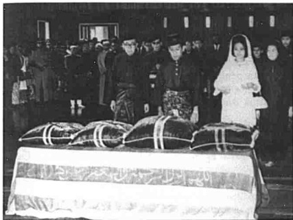
Pemergian tokoh besar yang turut dirasai kehilangannya oleh negara.

Khidmat yang telah diberikan dalam pelbagai kementerian meletakkan diri beliau di tahap yang tinggi. Ketokohan dirinya sebagai pemimpin dilihat daripada sifat ketegasan dan pendirian yang kukuh. Keyakinannya terhadap politik dan kemajuan negara menyebabkan beliau disanjung dan dihormati oleh setiap lapisan masyarakat.