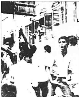
Peristiwa Darurat 1969 yang membawa perubahan besar dalam dasar pentadbiran negara.

Keadaan negara yang huru-hara pada masa peristiwa tersebut memaksa Tunku Abdul Rahman meletakkan negara di bawah Undang-undang Darurat. Sebuah majlis yang dinamakan "Majlis Gerakan Negara" (MAGERAN) ditubuhkan dan Tunku Abdul Rahman telah melantik Tun Abdul Razak bin Dato' Hussein sebagai pengarah. Berikutan itu, Tun Abdul Razak kemudiannya telah meminta jasa baik Tun Dr. Ismail agar menjadi Timbalan Pengarah MAGERAN. 23