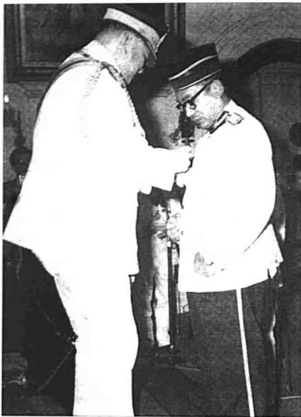
Sultan Johor kelihatan sedang mengurniakan darjah kebesaran (SPMJ) kepada Menteri Keselamatan Dalam Negeri Malaysia, Dato' Dr. Ismail Dato' Haji Abdul Rahman di hari keputeraan baginda.