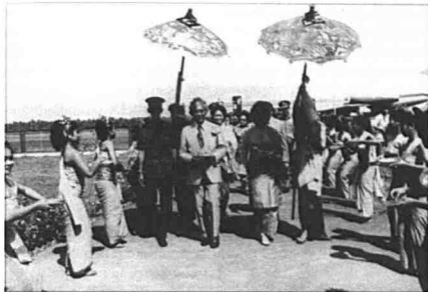
Mesyuarat Jawatankuasa Sempadan Malaysia-Indonesia, Timbalan Perdana Menteri, Tun Dr. Ismail tiba di Bali pada 3.7.1973.

Kestabilan politik dan keharmonian hidup yang telah dicapai setelah Peristiwa 13 Mei dapat dijadikan ukuran kemampuan Tun Dr. Ismail untuk mengembalikan semula keyakinan rakyat dan seterusnya membawa negara melangkah ke zaman baru. 19