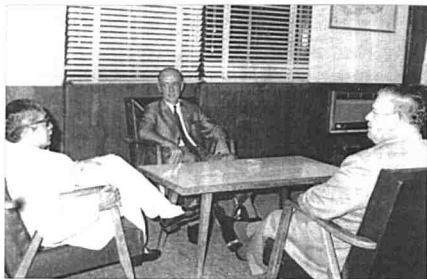
Ketua parti pembangkang New Zealand, Tuan Norman Kirk telah mengunjungi Yang Berhormat Menteri Hal Ehwal Dalam Negeri, Tun Dr. Ismail bin Dato' Haji Abdul Rahman di pejabatnya di Kuala Lumpur pada 5.6.1970.

ketegasan dan berhati-hati dalam sesuatu situasi memang wajarlah beliau dapat membantu menyelesaikan keadaan yang huru-hara itu.