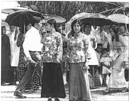
Walaupun cuaca amat panas, orang ramai tidak melepaskan peluang untuk melihat wajah Timbalan Perdana Menteri, Tun Dr. Ismail di Mersing.

Tun Dr. Ismail mempunyai keyakinan penuh terhadap masa depan negara. Beliau yakin rakyatnya akan mempunyai kekuatan rohani dan jasmani yang besar untuk menempuh masa depan yang cemerlang. Jika ditinjau daripada kata-kata beliau ternyata beliau seorang yang optimis. Sikapnya ini sering diperkatakan dalam ucapan-ucapannya. Menurut beliau, untuk berjaya dalam apa jua bidang ia bergantung kepada sikap dan pandangan hidup. Seseorang itu mestilah sentiasa membuka fikiran seluas mungkin untuk menerima pendapat orang lain. Dalam hal ini, beliau bersikap fleksibel. Beliau percaya orang Melayu akan terus diterima sebagai kumpulan pemimpin bangsa dan tanah air. 2