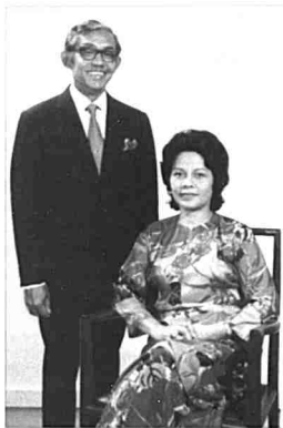
Tun Dr. Ismail bersama isteri, Toh Puan Norashikin bt. Dato' Mohd Seth.

terhadap anak-anak. Seperti mana bapanya, Tun Dr. Ismail juga meletakkan disiplin sebagai keutamaan dalam mendidik anak-anak agar menjadi orang yang berguna. Walaupun beliau tegas, sifat-sifat penyayang sebagai seorang ayah tetap ada terutama kepada anak bongsunya. 20