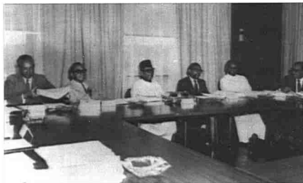
Mesyuarat pertama jemaah menteri baru di Bangunan Parlimen, Kuala Lumpur, pada 13.5.1964. Kelihatan duduk dua dari kiri ialah Tun Abdul Razak, Tunku Abdul Rahman dan Tun Dr. Ismail serta para menteri yang lain.

Berikutan dengan kemenangan Perikatan dalam Pilihan Raya Persekutuan 1959, Tunku Abdul Rahman telah menyusun jemaah menteri bagi Persekutuan Tanah Melayu. Dalam susunan semula jemaah menteri Tun Dr. Ismail telah dilantik sebagai Menteri Hal Ehwal Luar Negeri. 5