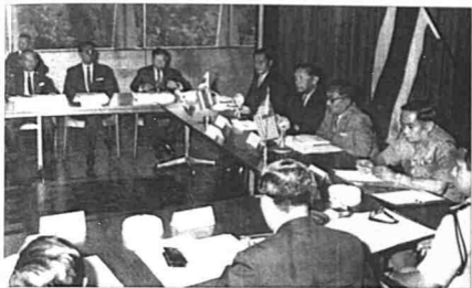
Mesyuarat Ke 5 Jawatankuasa Sempadan telah dibuka di Kuala Lumpur, pada 9.3.1967. Mesyuarat selama dua hari itu diadakan di Bangunan Parlimen. Menteri Hal Ehwal Dalam Negeri, Tun Dr. Ismail bin Dato' Abdul Rahman ialah pengerusi bersama mesyuarat itu bagi kali yang akhir kerana beliau akan bersara dari kabinet Malaysia disebabkan keuzuran.