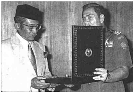
Yang Amat Berhormat Timbalan Perdana Menteri, Tun Dr. Ismail bin Dato' Abdul Rahman sedang melakukan lawatan rasmi ke Indonesia pada 8.3.1972. Tun Dr. Ismail telah mengunjung Tuan Yang Terutama Menteri Negara Bagi Pertahanan Indonesia, Jeneral M. Panggabean di Wisma Yuni.

Walaupun wujud perbezaan corak kepimpinan antara beliau dengan Tun Abdul Razak tetapi beliau dapat menyesuaikan diri berkhidmat di bawah pimpinan Tun Abdul Razak. Memang diakui bahawa Tun Dr. Ismail mempunyai pendekatan yang tegas. Namun begitu, beliau tetap menjalankan tugas-tugas yang diarahkan oleh Tun Abdul Razak sebagai Perdana Menteri. 29