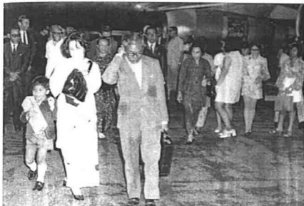
Yang Berhormat Menteri Hal Ehwal Dalam Negeri, Tun Dr. Ismail Dato' Haji Abdul Rahman, yang telah berada di London selama 10 minggu untuk mendapat rawatan perubatan, telah kembali ke Kuala Lumpur pada 19.5.1970.

Walaupun timbul pelbagai spekulasi, Tun Dr. Ismail mengatakan bahawa peletakan jawatan tersebut dilakukan kerana keuzurannya yang memerlukan beliau berehat. Dalam ucapan perpisahan menerusi Radio Televisyen Malaysia (RTM), Tun Dr. Ismail menjelaskan walaupun perkhidmatannya masih diperlukan khususnya dalam Kementerian Hal Ehwal Dalam Negeri, namun beliau terpaksa berundur. Tambahan pula, kesibukannya pada masa lalu telah menghalang beliau untuk berehat dan berfikir sebagai ahli politik. Oleh itu, beliau tetap mengambil keputusan untuk bersara. Antara ucapan beliau berbunyi: