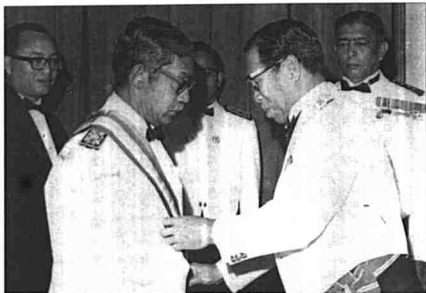
Timbalan Perdana Menteri, Tun Dr Ismail menerima pingat Sri Penglima Darjah Kinabalu daripada Yang Dipertuan Negara Sabah, Tuan Pengiran Haji Ahmad Raffae di istana. Anugerah ini membawa gelaran Dato'.

"Sekalipun dalam perkembangan sekarang ada rasa bimbang atas kegiatan satu kaum lain, tetapi saya yakin nasib bangsa Malaysia, harapannya untuk menuju ke muka sebagai bangsa yang progresif adalah terjamin." 3